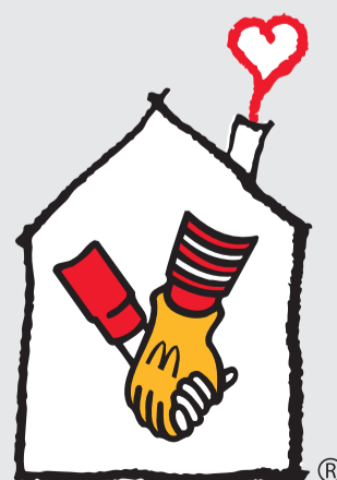
Fundacja Ronald McDonald