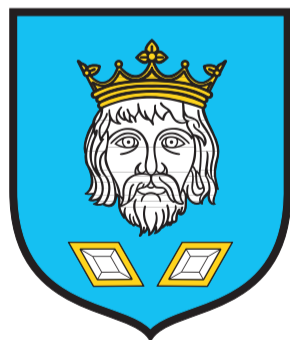
Miasto i Gmina Szamotuły